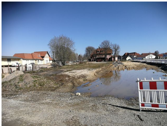
Nördlicher Teil des Plangebiets

Besonderen Schutzbedarf in Hinblick auf die Eingriffsbilanzierung haben die alten Laubbäume.