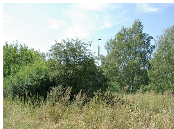
Ruderalfluren und Gehölzbestände