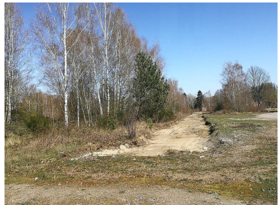
Birkenpionierwald und ehem. Gleisanlage